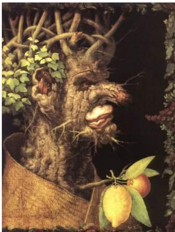
L'Hiver – Giuseppe Arcimboldo 1573 – huile sur toile

Giuseppe Arcimboldo , Arcimboldi ou Arcimboldus (1527-1593) est un peintre maniériste.